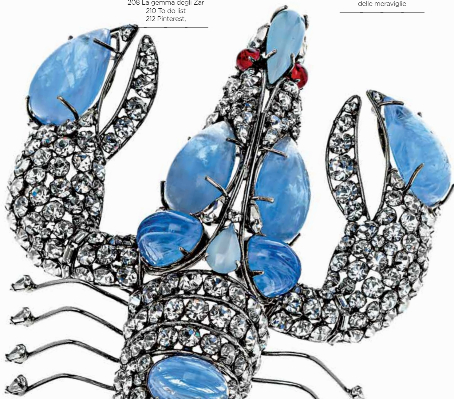
Lobster Brooch by Iradj Moini, 1995.